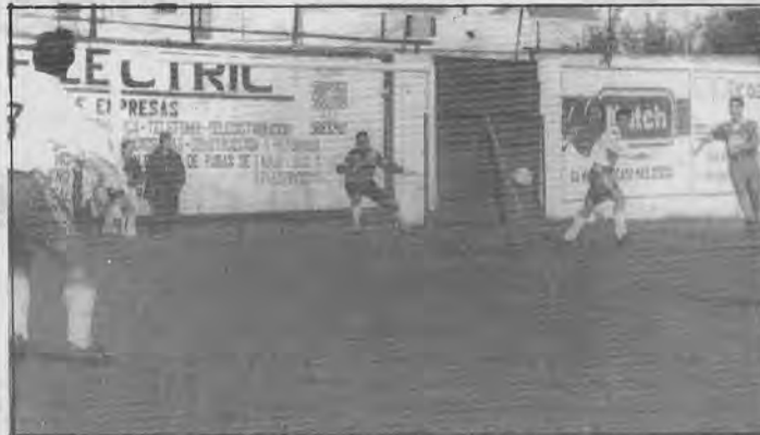
El Alcalá -con Choya y Sutil en acción- no vió puerta con el Villanueva y el domingo la encontró.

Los alcalareños casi jugaron andando y los moricos -o alcalareños también si me apuraran- parecían jugar con una 'pata coja', porque algunos ni aparecían por el campo.